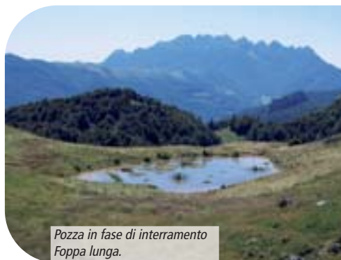
Pozza in fase di interramento Foppa lunga.