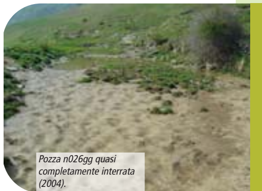
Pozza n026gg quasi completamente interrata (2004).

Le raccolte d'acqua più interessanti dal punto di vista biologico sono quelle in cui si sono concentrate le indagini negli anni successivi, perché ricche di specie importanti dal punto di vista conservazionistico. Il censimento confermò la presenza di importanti popolazioni di tritone crestato italiano (che qui giunge fino a 1.675 m di quota) e di ululone dal ventre giallo, inoltre vennero osservate popolazioni alticole di raganella italiana. Fu esclusa la presenza di tritone alpestre. Nel corso del 2005 il comune di Gorno recuperò alcune pozze presso la strada che conduce verso la Baita Grem. Questo ripristino ha portato al recupero funzionale per l'abbeverata di tre pozze