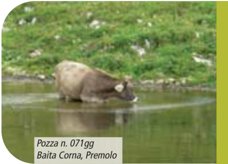
Pozza n. 071gg Baita Corna, Premolo

Si raggiunge così il duplice scopo enunciato in precedenza: il mantenimento dell'uso agricolo della pozza e la salvaguardia delle specie di anfibi.