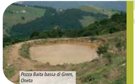
Pozza Baita bassa di Grem, Oneta

Nel SIC Valle Nossana - Cima Grem sono previste il recupero di una pozza presso le Cime di Belloro e la pulizia di altre due nella medesima zona. Inoltre collegato ad un capitolo parallelo avverrà il completo recupero della pozza in località Piazzola (Gorno).