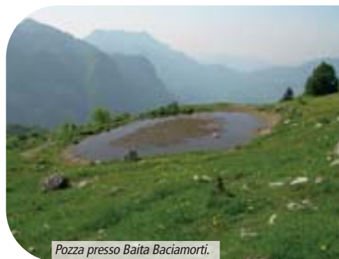
Pozza presso Baita Baciamorti.