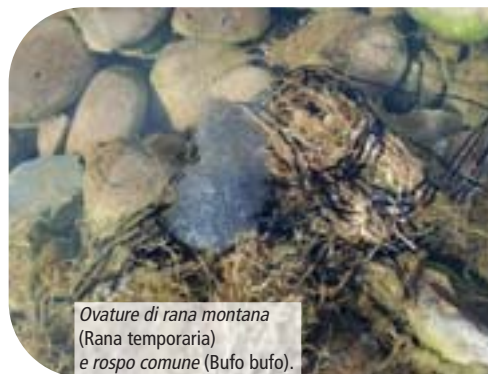
Ovature di rana montana (Rana temporaria) e rospo comune (Bufo bufo).