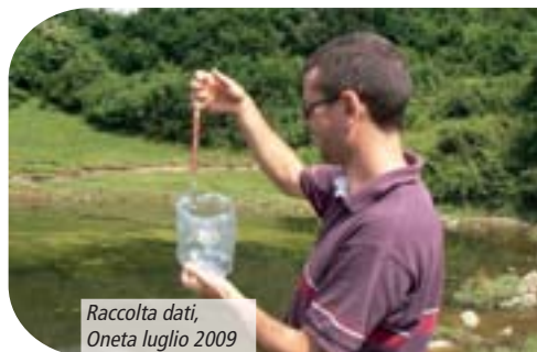
Raccolta dati, Oneta luglio 2009

Salamandra alpina – Salamandra atra : monitoraggio e censimento delle stazioni storiche e attuali. Si studierà la distanza genetica tra le popolazioni orobiche e quelle proprie della catena alpina.