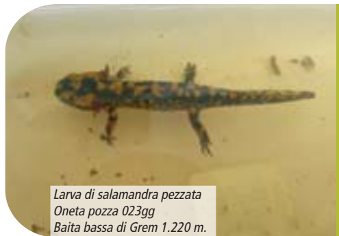
Larva di salamandra pezzata Oneta pozza 023gg Baita bassa di Grem 1.220 m.

Questo anfibio è diffuso in 4 pozze collocate sotto i 1.220 m, si riproduce usualmente nelle acque correnti ed occasionalmente nelle pozze di alpeggio.