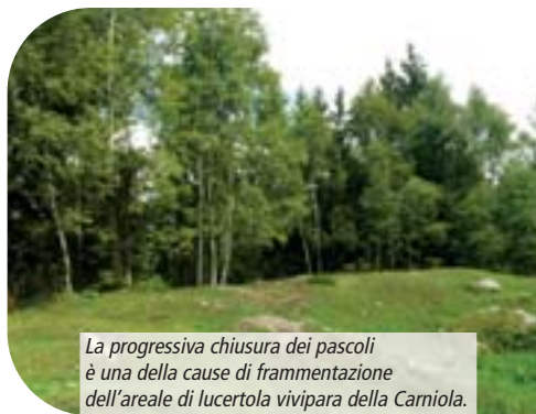
La progressiva chiusura dei pascoli è una delle cause di frammentazione dell'areale di lucertola vivipara della Carniola.

L'analisi genetica ha evidenziato l'esistenza di tre aplotipi di Zootoca vivipara carniolica : uno tipico della Val Brembana, un nuovo aplotipo conosciuto solo in un'area ristretta della Valle Seriana ed un terzo situato poco al di fuori dei confini del Parco. Le due sottospecie convivono a breve distanza nella zona delle valli di Mezzoldo. Lucertola vivipara presenta un buono stato di conservazione, perché le sue popolazioni sono in continuità con l'areale principale e la specie si adatta meglio alle alte quote, che sono le zone più integre del Parco. Lucertola vivipara della Carniola ha evidenziato un areale frammentato (vedi figura), con popolazioni spesso tra di loro separate da porzioni di territorio con aree non idonee, come le grandi estensioni boschive e i fondovalle antropizzati.