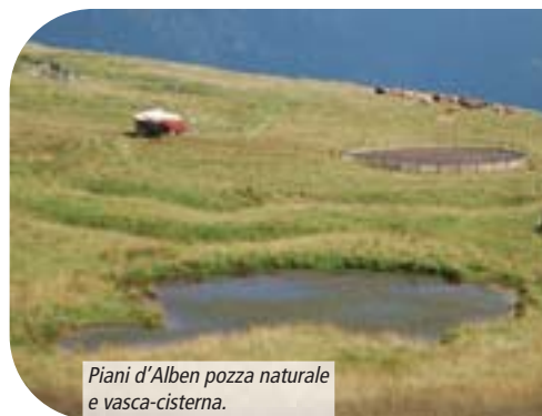
Piani d'Alben pozza naturale e vasca-cisterna.