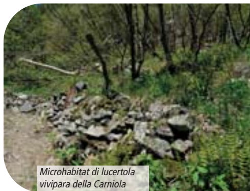
Microhabitat di lucertola vivipara della Carniola

la sottospecie " carniolica ". Nella Valle Brembana la situazione è diversa: la lucertola vivipara della Carniola è presente in quasi tutta la Valle Stabina e nella parte alta della valle, fatto salvo per zone confiniali del crinale Valtellinese e per la zona della Valle di Carona dove è presente la sottospecie nominale.