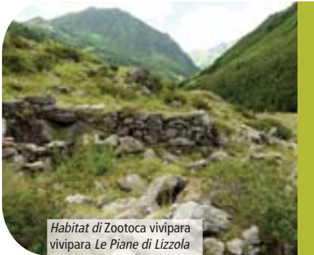
Habitat di Zootoca vivipara vivipara Le Piane di Lizzola

Al termine di tutti questi rilievi ogni animale è stato liberato nell'esatto luogo di cattura. Importanti osservazioni sull'habitat hanno permesso di valutare eventuali minacce. I campioni raccolti sono stati inviati presso il CEALP Fondazione Mach di Trento che ha effettuato le analisi. I risultati hanno dimostrato la presenza di lucertola vivipara della Carniola in 6 nuove stazioni nel Parco. Le due sottospecie sembrano per ora complementari, sia per quanto riguarda l'areale distributivo, sia per quanto riguarda le quote altimetriche: lucertola vivipara della Carniola è presente da 950 m a 1.880 m di quota; lucertola vivipara si può osservare tra 1.150 m e 2.300 m. La sottospecie "vivipara" è presente in tutta la Val di Scalve, dal fondovalle fino ad oltre 2.000 m; in Valle Seriana è presente nel versante orografico sinistro fino al gruppo della Presolana e lungo il versante orografico destro fino all'altezza di Valgoglio. A meridione di questa zona è stata invece osservata