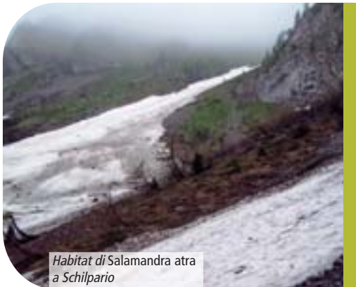
Habitat di Salamandra atra a Schilpario

La ricerca è iniziata con le indagini bibliografiche e museali dalle quali è sostanzialmente emerso il quadro delle conoscenze storiche precedenti al 1950. Sono stati contattati i musei naturalistici di Bergamo, Milano, Morbegno e Verona. Contestualmente, la ricerca bibliografica ha interessato alcune pubblicazioni storiche, tra le quali "Erpetologia orobica" di Pietro Giacomelli, articolo edito negli Atti dell'Ateneo di Scienze Lettere ed Arti in Bergamo (1897) e "Fauna alpina" di Renato Perlini, volume pubblicato dall'Ist. Ital. Arti Grafiche (1923). In particolare il Giacomelli ci informa sulla più antica segnalazione di salamandra alpina orobica raccolta da G.B. Adami nel 1873 sul versante nord della Presolana, in territorio di Colere "...sotto le pietre e sopra il limite della vegetazione...", esemplare ancora conservato nella collezione erpetologica De Betta al Museo Civico di Storia Naturale di Verona. L'utilizzo di segnalazioni attendibili raccolte per la stesura dell'Atlante degli Anfibi e Rettili della Lombardia (2004) ha consentito di focalizzare meglio le possibili località di presenza di questa salamandra sulle Prealpi ed Alpi Orobie.