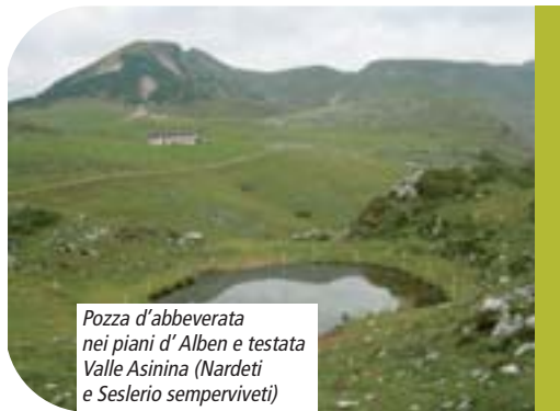
Pozza d'abbeverata nei piani d'Alben e testata Valle Asinina (Nardeti e Seslerio semperviveti)

animali o lo rendono estremamente difficoltoso (21,4%), scarsità di potenziali rifugi terrestri (pietre e massi presso le sponde, muretti a secco, piante riparie) (32,1%), vicinanza di strade carrozzabili che espongono a rischio di investimento gli anfibi (17,9%).