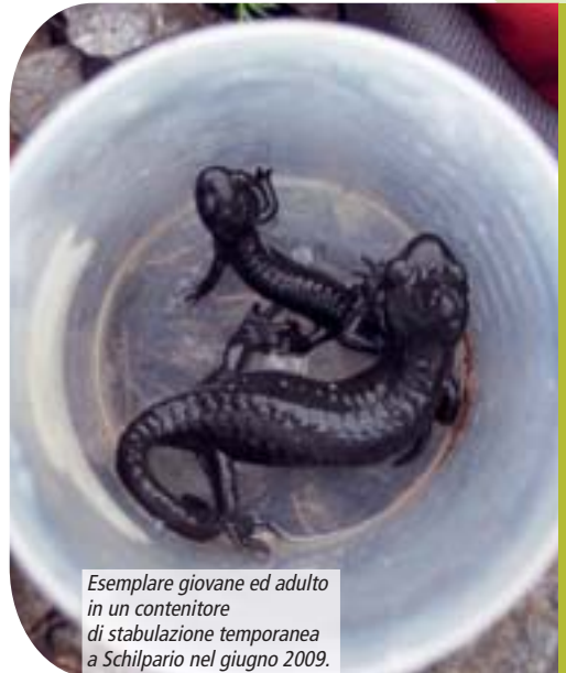
Esemplare giovane ed adulto in un contenitore di stabulazione temporanea a Schilpario nel giugno 2009.

che il Parco delle Orobie Bergamasche può vantare all'interno del suo territorio. Sulla base delle informazioni attuali, come riportato dall'Atlante degli Anfibi e dei Rettili della Lombardia, la salamandra alpina sembra essere presente in questa regione in tre settori: Alpi Retiche (SO), massiccio dell'Adamello (BS), Alpi e Prealpi Orobiche (BG, SO, BS); i tre distretti sono separati tra loro da due profondi solchi glaciali quali la Valtellina e la Val Camonica. Le popolazioni di Salamandra atra della dorsale orobica si caratterizzano geograficamente come entità prettamente lombarda, separata rispetto all'areale principale della specie sul versante meridionale delle Alpi. Lo studio, essendo finalizzato alla programmazione di azioni conservazionistiche, non si è limitato alle aree rientranti nella perimetrazione amministrativa del Parco.