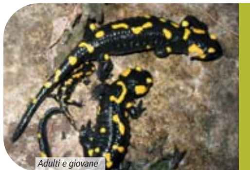
Adulti e giovane