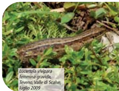
Lucertola vivipara femmina gravida, Teveno, Valle di Scalve, luglio 2009

inosservata nonostante sia ben distribuita all'interno del Parco e, in alcune zone, presente con le floride popolazioni. Vivendo a quote che vanno dai 1.300 m circa fino oltre i 2.200 m, questo piccolo sauro ha sviluppato una serie di adattamenti biologici che gli consentono di vivere anche in climi assai rigidi. Il più caratteristico di questi adattamenti, come indica il suo nome, è la viviparità: le femmine dopo l'accoppiamento, che avviene generalmente tra aprile e maggio, trattengono le uova al loro interno senza deporle e spostandosi di volta in volta nei luoghi meglio esposti, rendono possibile il raggiungimento della miglior temperatura disponibile per lo sviluppo delle uova. Dopo un'incubazione di tre mesi circa, le femmine "partoriscono" dei piccoli caratterizzati da una livrea completamente nera che schiarisce gradualmente con l'accrescimento.