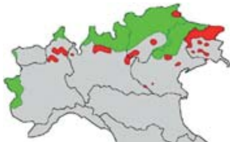
Area di distribuzione in Italia di lucertola vivipara della Carniola (rosso) e di lucertola vivipara (verde). Rielaborazione originale di Samuele Ghielmi.

L'indagine avviata con il progetto Anfi.Oro. ha lo scopo di definire in modo preciso l'areale delle due sottospecie di lucertola vivipara nel Parco delle Orobie Bergamasche. L'unico modo attualmente possibile per distinguere le due sottospecie è effettuare analisi genetiche sui campioni raccolti. Attraverso l'analisi del DNA mitocondriale è possibile distinguere con certezza Zootoca vivipara vivipara da Zootoca vivipara carniolica . Come si può osservare leggendo le schede biologiche, lucertola vivipara della Carniola ha un areale limitato e si può considerare subendemica delle Alpi meridionali e della Pianura Padana Veneta. L'analisi distributiva si può osservare dalla cartina relativa all'areale conosciuto (aggiornato al 2004). È evidente perciò, a causa della rarità di lucertola vivipara della Carniola, che occorre definire su piccola scala la distribuzione, onde provvedere alla conservazione di questa interessante sottospecie.