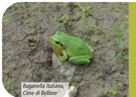
Raganella italiana, Cime di Belloro

È una specie ben distribuita nella zona considerata, dove può spingersi fino a 1.650 m sui versanti esposti a mezzogiorno, come ad esempio quello del Monte Grem. È presente in 10 pozze ma colonizza facilmente anche piccole raccolte d'acqua.