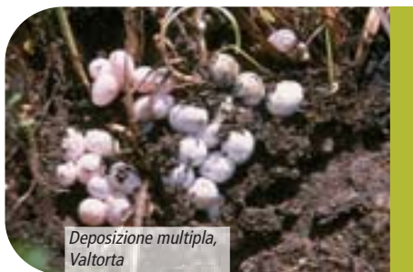
Deposizione multipla, Valtorta

L a lucertola vivipara della Carniola ( Zootoca vivipara carniolica ). Alla fine degli anni '90 in una delle ultime località di pianura in cui ancora è presente la lucertola vivipara (la riserva naturale "Palude Brabbia", VA), fu osservato per la prima volta un fatto curioso: qui la lucertola vivipara non era per nulla tale, ma bensì ovipara a tutti gli effetti, dal momento che deponesse uova bianche e pergamenacee che schiudevano dopo circa un mese di incubazione e ben diverse da quelle semitrasparenti a schiusa immediata della forma "vivipara". Tale particolarità fu peraltro osservata di lì a poco anche in altre popolazioni situate nella regione della Carniola in Slovenia.