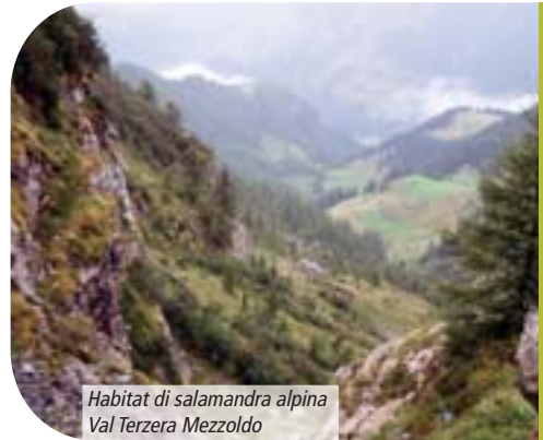
Habitat di salamandra alpina Val Terzera Mezzoldo