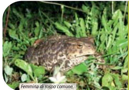
Femmina di rospo comune.

giorni. Durante questo periodo il maschio accoppiato può subire l'attacco di altri individui dello stesso sesso che cercano di sostituirsi a lui nell'accoppiamento. Le uova del rospo comune sono nere e vengono deposte una accanto all'altra e disposte in 2-4 file all'interno di un unico cordone gelatinoso trasparente lungo fino a circa 3 m, che di solito viene ancorato alla vegetazione acquatica o ad altro materiale sommerso. Ciascuna ovatura può contenere fino a 10000 uova, di norma il numero si aggira intorno a 4000-6000 uova. In genere la schiusa avviene dopo circa due settimane e l'embrione, ancora incapace di muoversi, rimane per qualche giorno attaccato al cordone gelatinoso. Lo sviluppo larvale dura dai due ai tre mesi. La maturità sessuale nei maschi è raggiunta al terzo o quarto anno di età, nelle femmine al quarto o al quinto. Sia i girini che gli adulti contengono nei loro tessuti una sostanza tossica che li rende potenzialmente inappetibili ai predatori. Per tale ragione il rospo comune risulta essere, tra gli anuri, la specie che forse meglio tollera la presenza di specie ittiche nel sito di riproduzione, tuttavia questo anfibio viene comunemente predato dalle bisce d'acqua, da uccelli e da mammiferi (p.e. mustelidi).