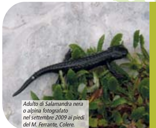
Adulto di Salamandra nera o alpina fotografato nel settembre 2009 ai piedi del M. Ferrante, Colere.

rigidi e prolungati durante i quali trova rifugio nel sottosuolo. L'attività annuale, che ha inizio allo scioglimento primaverile delle nevi, in estate si limita alle giornate caratterizzate da precipitazioni intense o protratte nel tempo, e termina all'inizio dell'autunno presso i siti di svernamento. Ciò che, tra gli anfibii italiani, l'accomuna alla salamandra di Lanza (l'altra salamandra alpina presente in alcune vallate del Piemonte: Salamandra lanzai ) è la possibilità di dar luogo al suo ciclo di vita in modo svincolato da raccolte o corsi d'acqua. Essendo vivipara, infatti, essa non depone larve acquatiche, ma partorisce due piccoli dalla lunghezza di 3-4 cm, simili ad adulti nell'utero materno, in un periodo di almeno due anni dall'accoppiamento. Gli adulti delle Orobie raggiungono una lunghezza indicativa di 11-12 cm ed un peso inferiore ai 10 g, i maschi presentano una cloaca lievemente in rilievo, a differenza delle femmine in cui questa è completamente piatta.