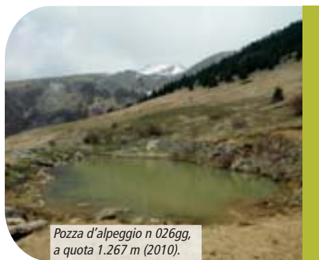
Pozza d'alpeggio n 026gg, a quota 1.267 m (2010).

Il Sito d'Importanza Comunitaria (SIC) Valle Nossana – Cima di Grem è uno dei più interessanti e ricchi di specie di anfibi e rettili nel Parco delle Orobie Bergamasche.