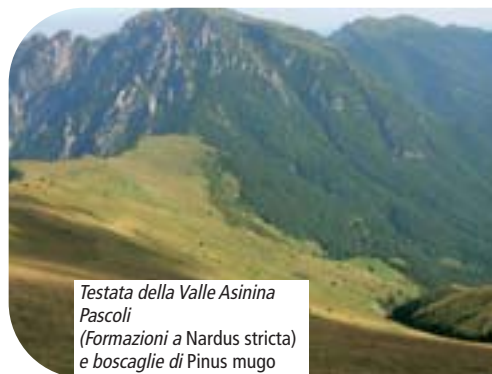
Testata della Valle Asinina Pascoli (Formazioni a Nardus stricta ) e boscaglie di Pinus mugo

le specie sono state riconfermate, ma per quasi tutte (ad eccezione di R. temporaria ) è stato riscontrato un calo delle presenze anche molto significativo.