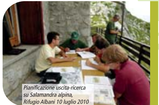
Pianificazione uscita-ricerca su Salamandra alpina, Rifugio Albani 10 luglio 2010

Il modulo Ri.Alp. ha previsto interventi volti a qualificare aree pascolive in stato di parziale degrado, incrementandone la biodiversità e rendendole nuovamente fruibili per il pascolo, nonché a fornire esempi di corrette attività di recupero ambientale in ambiti d'alpeggio. Con R.I.S.P.O.Sta., invece, è stato prodotto fiorume autoctono dagli alpeggi delle Orobie Bergamasche e della Grigna da utilizzare in successivi interventi estensivi di rinaturazione e recupero ambientale, con particolare riferimento agli impianti sciistici esistenti o di futura realizzazione. Con Anfi.Oro., grazie anche alla collaborazione con la Stazione Sperimentale per lo Studio e la Conservazione degli Anfibi Lago di Endine, è stato prodotto un attento quanto esaustivo monitoraggio circa la presenza di anfibi nei territori del Parco delle Orobie Bergamasche e della Riserva Naturale Pian di Spagna, la cui diffusione risulta attualmente non sufficientemente conosciuta. Alle attività di ricerca si sono affiancate azioni prettamente progettuali con lo scopo di recuperare alcune pozze per l'abbeveraggio in stato di abbandono, in quanto siti di grande importanza per la riproduzione degli anfibi. Il presente volume approfondisce le azioni condotte per Anfi.Oro. e dà conto degli esiti ottenuti.