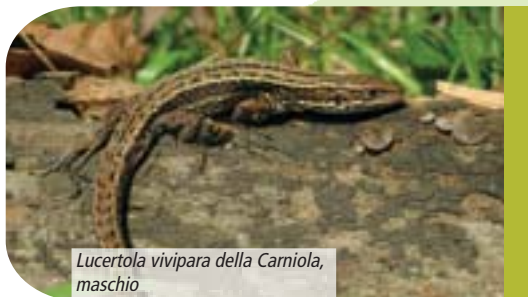
Lucertola vivipara della Carniola, maschio

livello genetico che si riscontra una tale distanza da far pensare ad un periodo di reciproco isolamento delle due sottospecie valutato in 1,2 milioni di anni. Mentre la popolazione rifugiata nella Penisola Balcanica sotto la pressione dei rigidi climi glaciali sviluppò la viviparità ( ssp. vivipara ), quella rifugiata nella Pianura Padana mantenne l'ancestrale modalità di riproduzione ovipara ( ssp. carniolica ). Dopo il definitivo ritiro dei ghiacciai quaternari la forma vivipara, più adatta ai climi d'alta quota, ricolonizzò rapidamente le parti più elevate dell'arco alpino liberate dai ghiacci, mentre la forma ovipara, partendo dalle aree di rifugio meridionali, riuscì a "prendere possesso" di quelle porzioni di arco alpino e prealpino che furono poco interessate dalle grandi lingue glaciali. È proprio in questo contesto che si inserisce la presenza della lucertola vivipara e della lucertola vivipara della Carniola nel Parco: la prima proveniente da nord/est avrebbe colonizzato le porzioni più elevate del territorio orobico, dal massiccio della Presolana via via lungo il crinale che fa da spartiacque con la Valtellina; la seconda invece provenendo sia dai rifugi padani (dalle risorgive e dalle aree palustri) sia da rifugi montani non interessati dai ghiacciai, colonizzò diversi siti della media e alta Valle Brembana oltre che alcune località della media Valle Seriana.