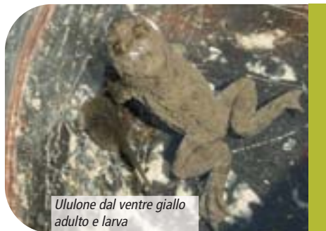
Utlulone dal ventre giallo adulto e larva

a 1.685 m. La specie sembra essere stabile, anche se ha perduto un sito riproduttivo rispetto al 2004.