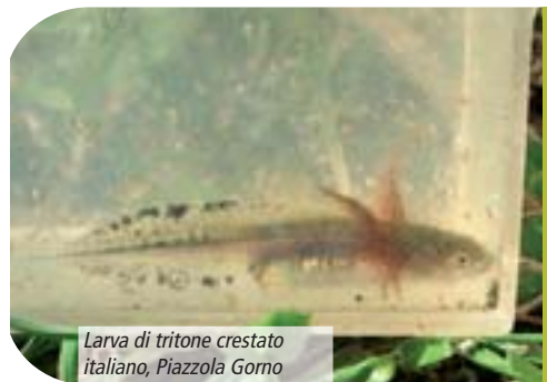
Larva di tritone crestato italiano, Piazzola Gorno

È una specie piuttosto diffusa in questo SIC in quanto si trova da 1.150 m a 1.675 m di quota in svariati ambienti come pascoli, boschi di latifoglie e pascoli cespugliosi. È stato censito in 22 pozze e il suo stato di conservazione si può considerare buono.