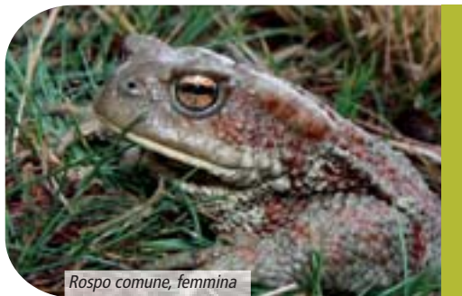
Rospo comune, femmina

funzione di un utilizzo maggiore delle risorse trofiche stagionali.