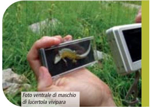
Foto ventrale di maschio di lucertola vivipara

del luogo di cattura, altitudine, habitat, microhabitat ed esposizione del versante. Per le femmine è stato importante rilevare l'eventuale stato di gravidanza.